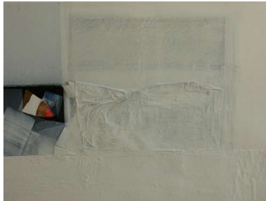
Oli sobre tela, 2011 60x80 cm

Hi ha obra seua en el Museu d'Art Contemporani de Salamanca, en l'Ateneu Barceloní, en la Fundació la Caixa, en el Consell d'Eivissa, en l'Ajuntament de Santa Eulàlia, en l'Ajuntament d'Eivissa, en la Fundació Fracado de Milà, En la col·lecció d'art de la CAM (Caixa de la Mediterrània), en la Fundació sa Nostra, i en col·leccions privades de diferents llocs del món.