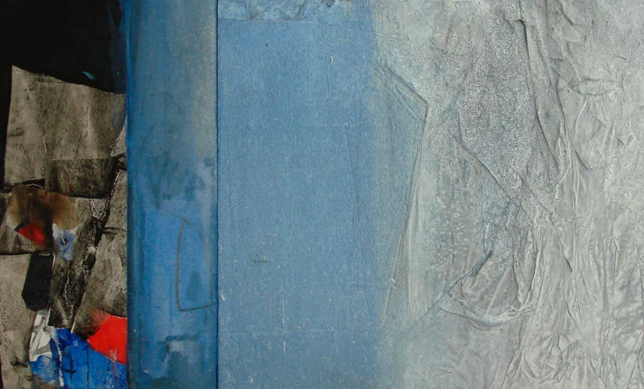
Oli sobre tabla, 2011 46x68 cm