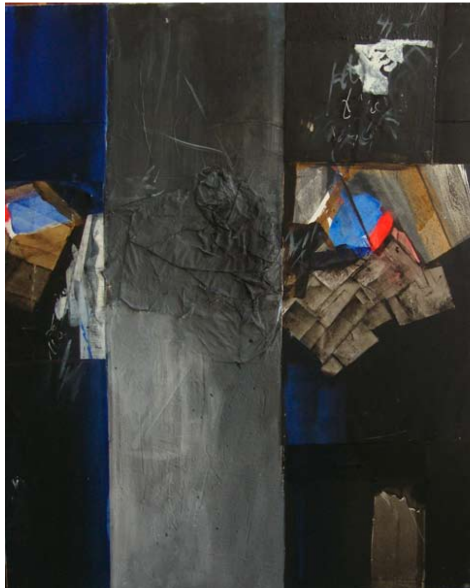
Oli sobre tela, 2011 100x80 cm