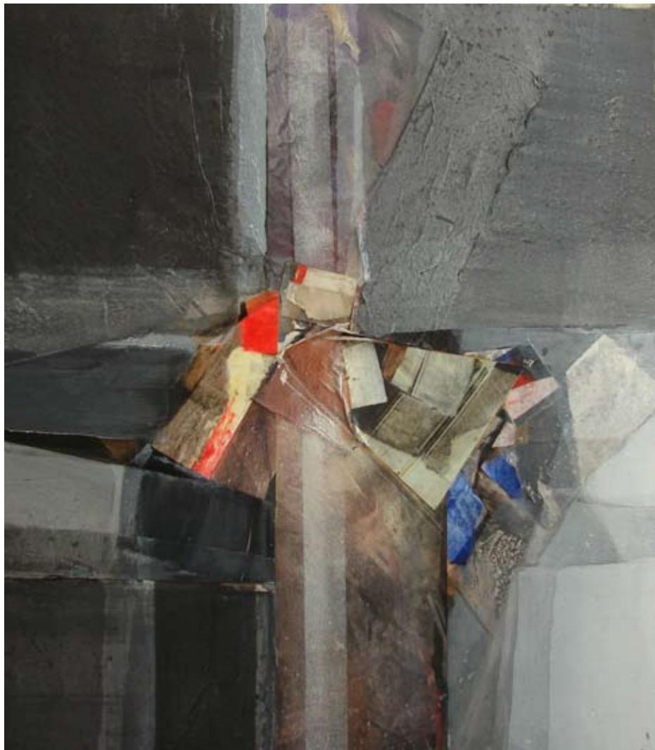
Oli sobre tela, 2011 81x71 cm