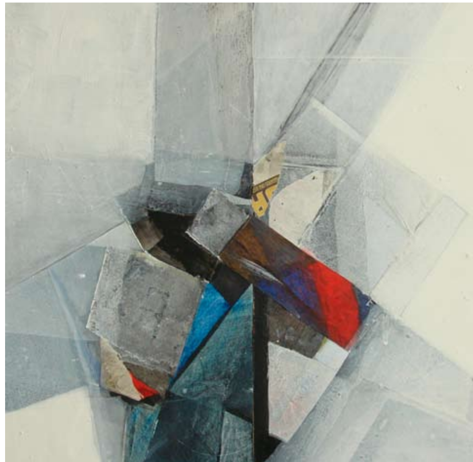
Oli sobre tela, 2011 40x40 cm