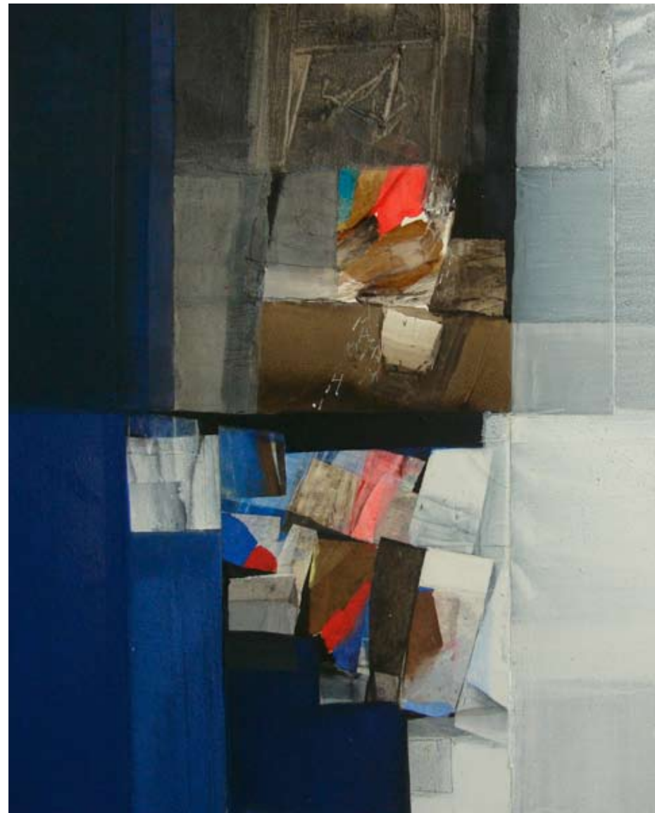
Oli sobre tela, 2011 100x80 cm