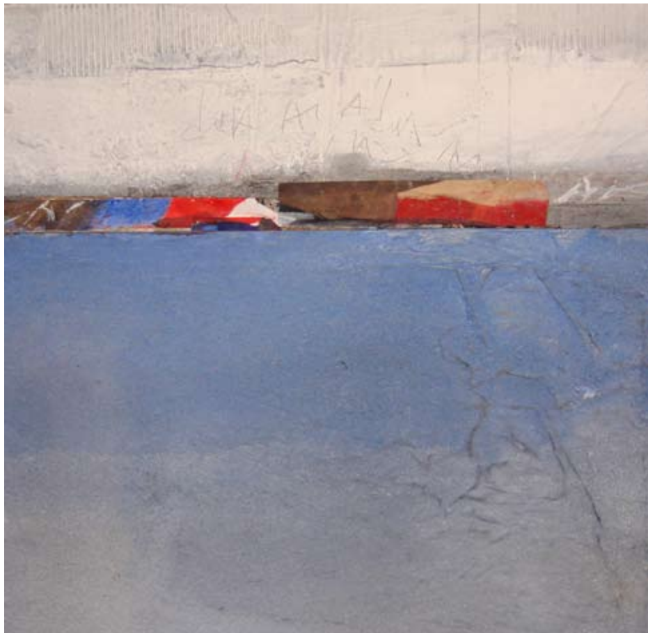
Oli sobre tela, 2012 40x40 cm