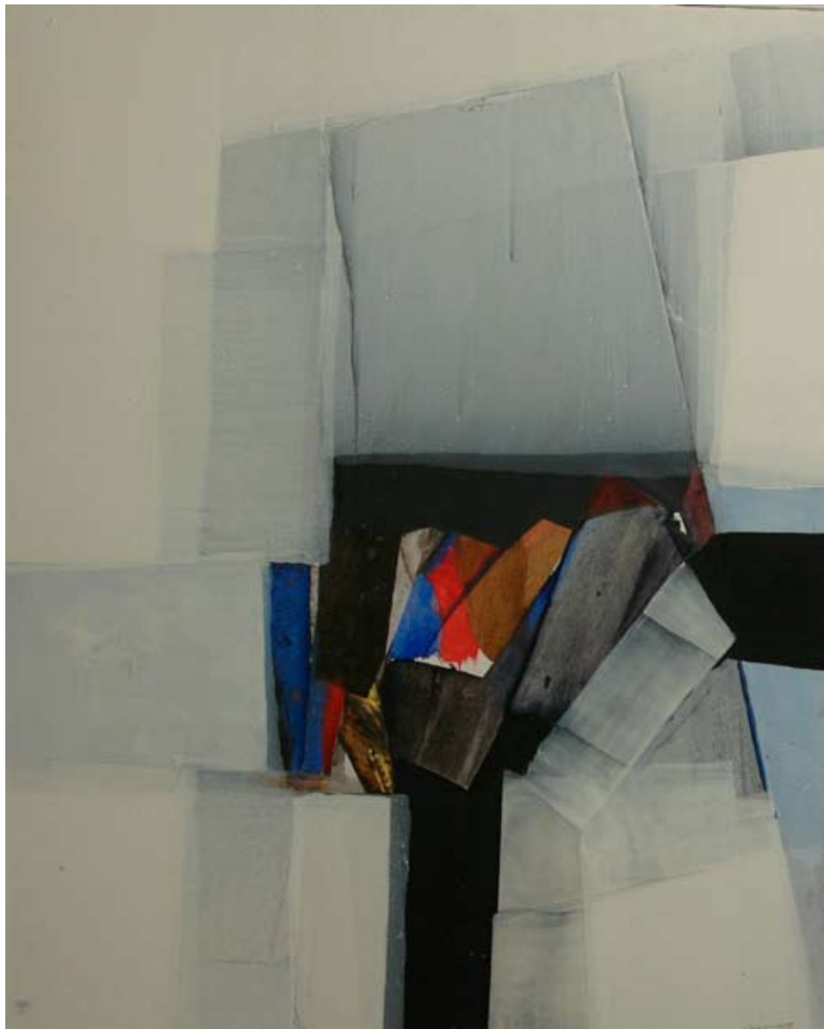
Oli sobre tela, 2011 92x72 cm