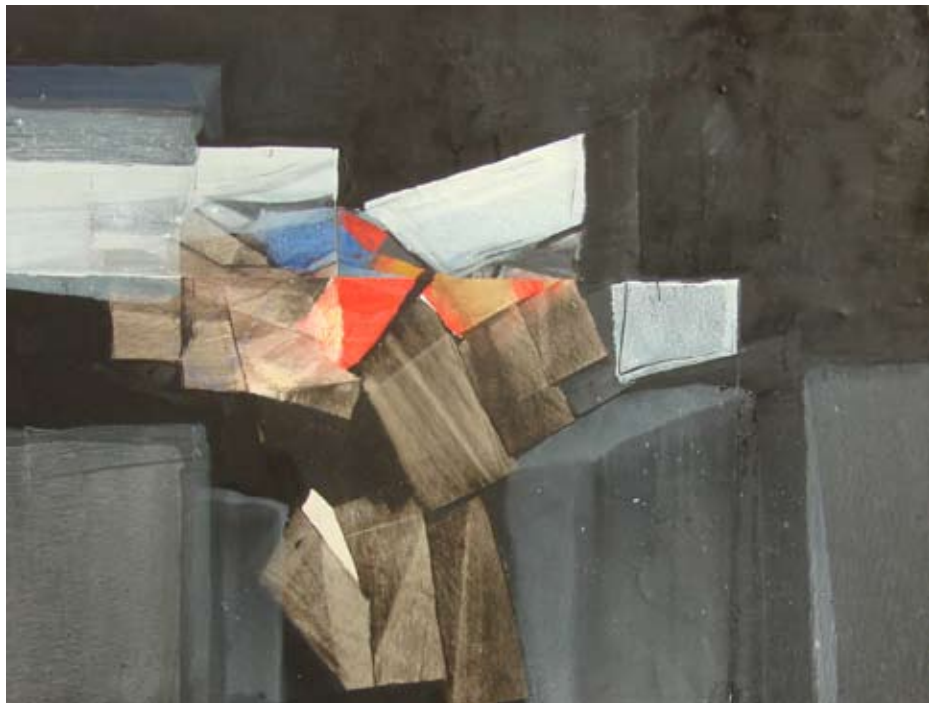
Oli sobre tela, 2012 50x65 cm